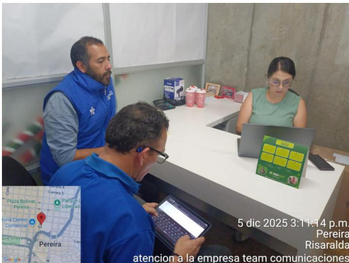
5 dic 2025 3:11:14 p.m. Pereira Risaralda atencion a la empresa team comunicaciones